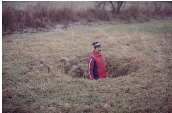
Bild 1 Dolinen Felslindl – Kataster-Nr. 6335/D010 (Foto Ernst Klann 1989)

Von den erfassten (13291) Objekten sind 8335 Dolinen (62,7 %) mit Dolinenaufnahmebogen/-liste erfasst und einer DKN-Katasternummer zugeordnet (siehe z. B. Bild 1)