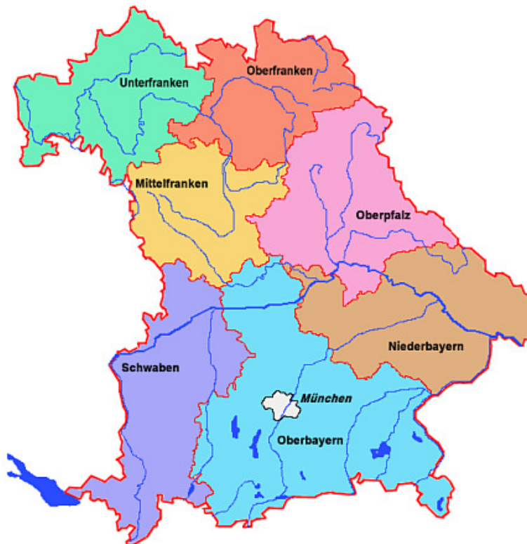
Übersicht 1: Regierungsbezirke im Bundesland Bayern

Nachfolgende Chronologie zeigt grob die wichtigsten Stationen/Daten zum DKN seit seiner Gründung (Langfassung siehe http://www.dolinenkataster.de/index.php?main=chronologie&over=11 )